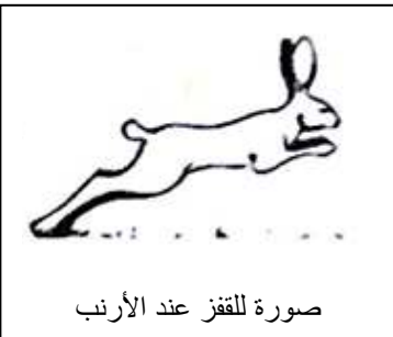
صورة للقفز عند الأرنب