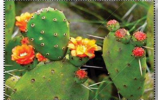
السند 01 : نبات التين الشوكي

التعليمات: من خلال النص و السندين و معلوماتك