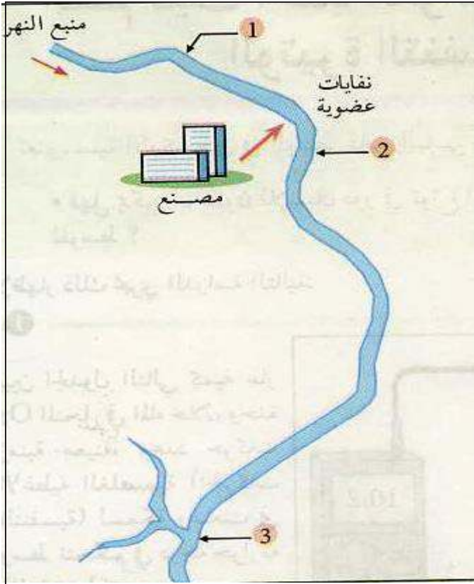
السند 3 / مخطط يوضح موقع مصنع الحليب