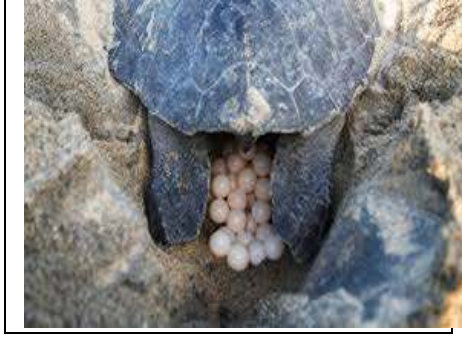
السند 02: سلحفاة تضع البيوض