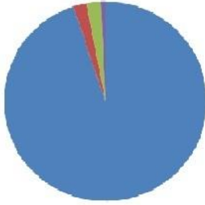
دائرة نسبة لوارادات الجزائر