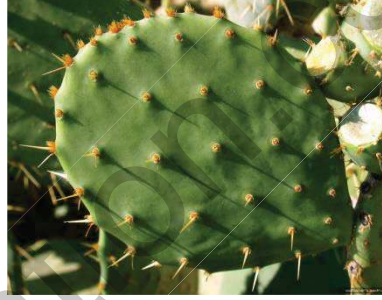
نبات التين الشوكي