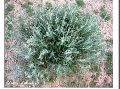
نبات السنوبر الحلبي

التعليمات : بالإعتماد على السندات و مكتسباتك القبلية .