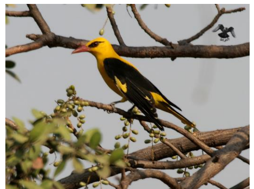
السند 1: طائر الصفاري يتغذى أساسا على الحشرات

إعتادا على الأسناد المقدم إليك ومكتسباتك القبلية أجب عما يلي: