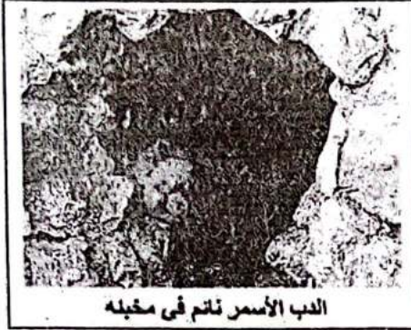
الدب الأسمر نائم في مخبئه

سنويا تغادر بعض الطيور البرية مواطنها الأصلية باتجاه إفريقيا من الجزائر وفي أيار أكتوبر سنة 2005 تم إحصاء ما يقارب 4000 مهاجر ببخيرة رغبة بالجزائر العاصمة.