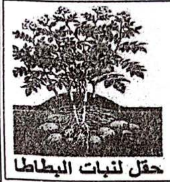
حقل لنبات البطاطا