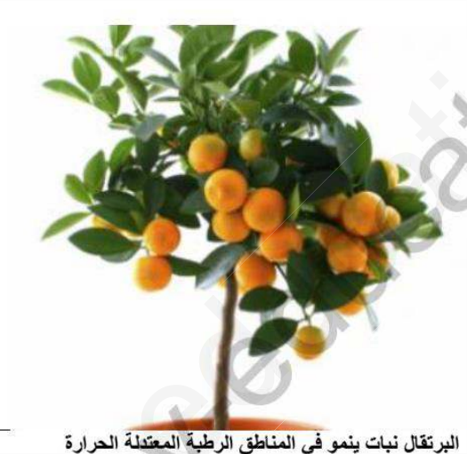
البرتقال ينمو في المناطق الرطبة المعتدلة الحرارة