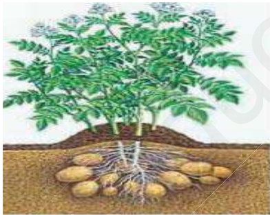
حقل لنبات البطاطا

مروراً بالجزائر. ففي نهاية أكتوبر سنة 2005 م تم إحصاء ما يقارب 4000 طائراً مهاجراً ببخيرة رغبة بالجزائر .