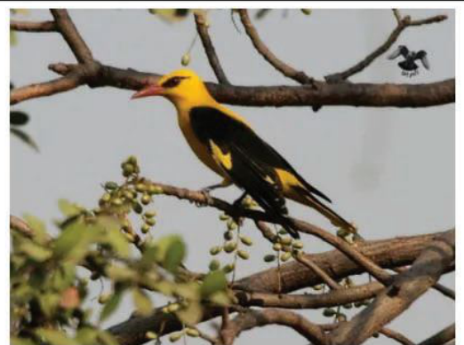
السند 1: طائر الصفاري يتغذى أساسا على الحشرات

إعتادا على الأسناد المقدم إليك ومكتسباتك القبلية أجب عما يلي: