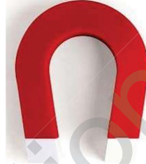
مغناطيس على شكل حرف U