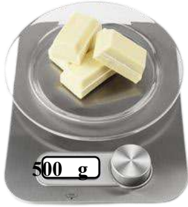
- الوثيقة 1 -

1- ما هو العامل الذي أدى الى انصهار الزبدة ؟