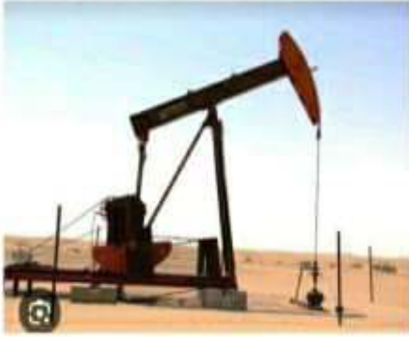
الشكل (1): تمثل الصورة نموذجا عن الحفارات المستعملة للحفر

في يوم 24 فيفري من كل سنة يحتفل الجزائريون بتأسيس المحروقات، أي استرجاع آبار النفط و الغاز من الاستعمار . في عام 2023 م انطلقت الأشغال لحفر بئر جديدة لاستخراج النفط في منطقة حاسي مسعود .