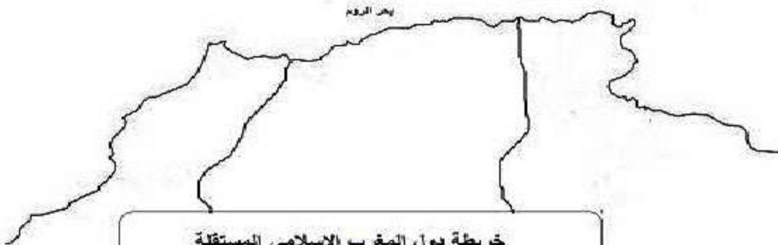
خريطة دول المغرب الاسلامي المستقلة

- إليك خريطة المغرب الإسلامي الصماء. المطلوب: - وقع عليها دول المغرب المستقلة مع تحديد عواصمها؟