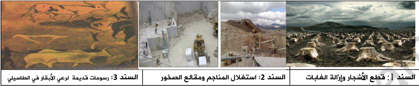
السند 1: قطع الأشجار وإزالة الغابات

لدراسة تطور منظر طبيعي عبر الزمن الجيولوجي قدمت لك السندات التالية: