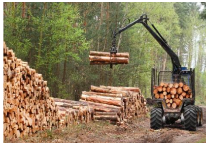
السند 2: استغلال خشب أشجار الغابات