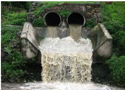
السند 1: تلوث مياه الواد