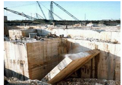
السند 1: مقلع للرخام

بالاعتماد على السياق، السندات المقدمة لك ومادرت أجب عما يلي: