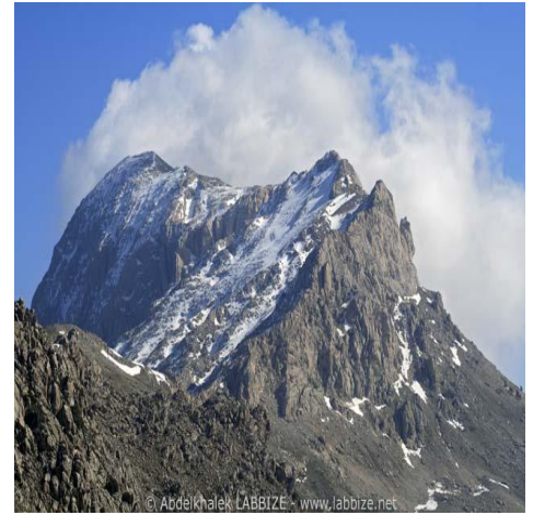
الوثيقة 1 : جبال جرجرة