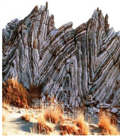
الوثيقة 2 : طيات