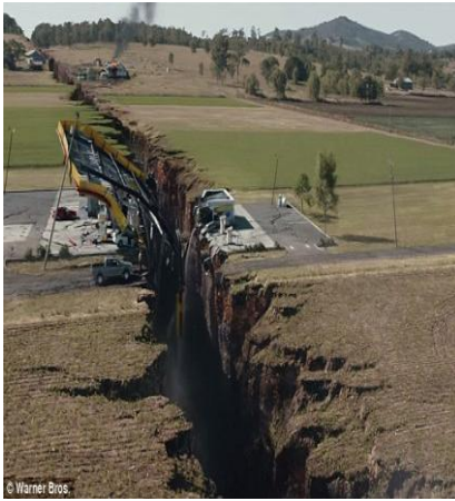
الوثيقة 3 : فالق