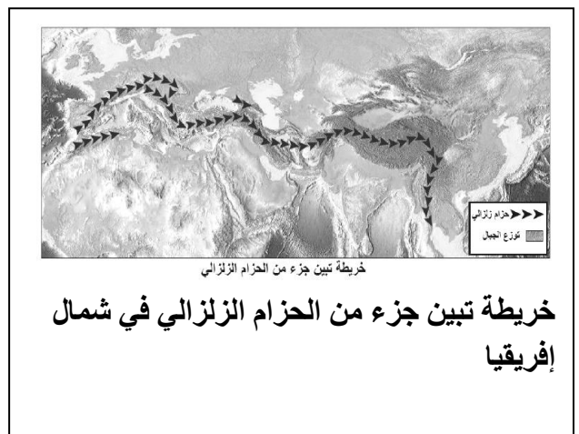
خريطة تبين جزء من الحزام الزلزالي في شمال إفريقيا