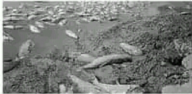
أسلاك نافذة فوق الأوحال بسد بوكردان، جنوب تيارة، بسبب جفاف السد.(سبتمبر 2021) الوثيقة (2)

سد بني هارون بولاية ميلة (شرق الجزائر) تحفة طبيعية، يصفي جمالا خلايا على المنظر الطبيعي بمياهه و جسوره و التنوع الحيواني به... بسعة تخزينية للمياه تقارب المليار متر مكعب، يوفر الماء الشروب لست (6) ولايات ، و يساهم في ري أكثر من 40 ألف هكتار من الأراضي الفلاحية. سد بني هارون مرود بمفرغ الفيضانات و حنفيات سفلى يساهم بتشغيلها في تنظيف الماء السطحي، و التخلص من الأوحال المتراكمة في عمق هذا السد. الوثيقة (1)