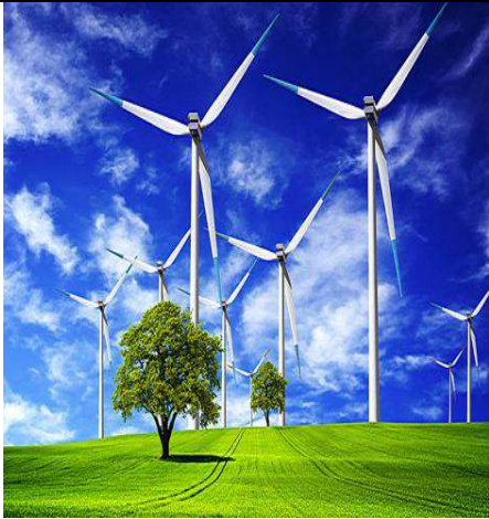
سند 3 / استغلال طاقة الرياح