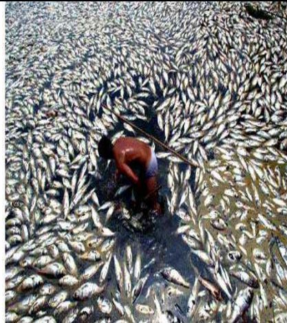
سند 2 / البترول مصدر للتلوث