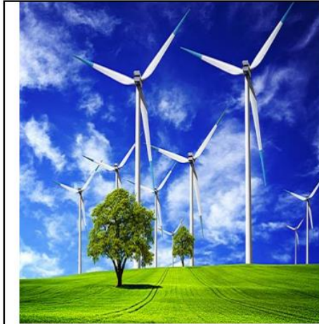
سند 3 / استغلال طاقة الرياح