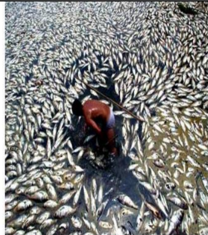
سند 2 / البترول مصدر للتلوث