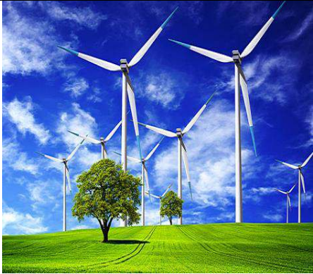
سند 3 / استغلال طاقة الرياح