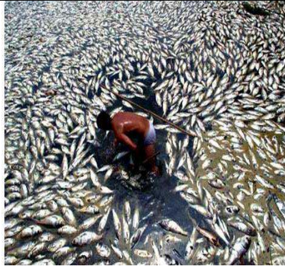
سند 2 / البترول مصدر للتلوث