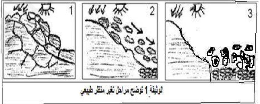
الوثيقة 1 توضح مراحل تغير منظر طبيعي

(...يؤثر الإنسان على المناظر الطبيعية في بعض المناطق بقطعه لأشجار الغابة والحرائق و الرعي العشوائي مما يتسبب في تعرية التربة وتعرضها للانجراف . كما يؤثر أيضا على التوازن الطبيعي باستعماله المفرط للمواد الكيميائية . والتلوث الصناعي والحضري...)