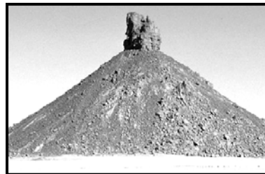
السند-5- بركان خامد من الهقار

التعليمة: بالاعتماد على معارفك و السندات :