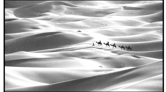
السند-2- تأثير الرياح