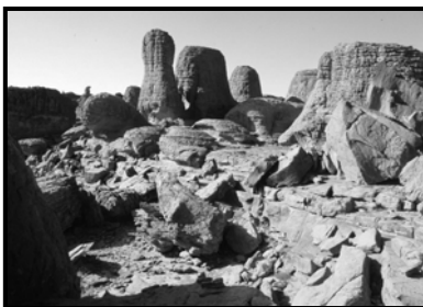
السند-4- منظر من الهقار