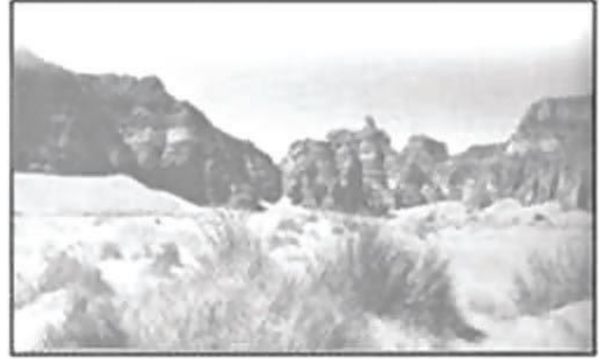
الوثيقة (01) منظر حالي

بالاعتماد على الوثيقة (01) ومعلوماتك السابقة :