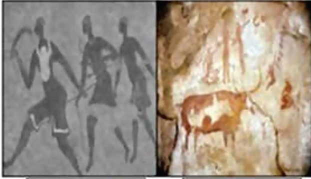
الوثيقة (02) نشاط الانسان القديم

إن سطح القشرة الأرضية في تغيّر دائم ، فالمناظر الطبيعية التي نراها اليوم لم تكن موجودة ذاتها خلال العصور السابقة، لغرض إبراز العوامل المتدخلة في تحديد شكل المناظر الطبيعية عبر الأزمنة الجيولوجية. إليك الوثائق التالية لمنطقة الطاسيلي :