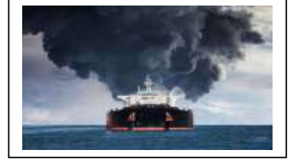
مظاهر التلوث البيئي