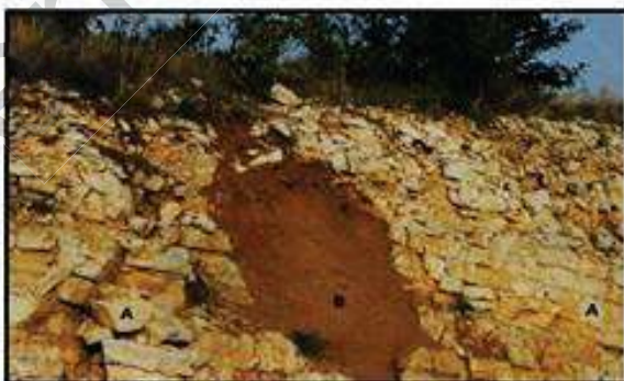
الوثيقة (3) : تربة كنسية يتخللها الفضل