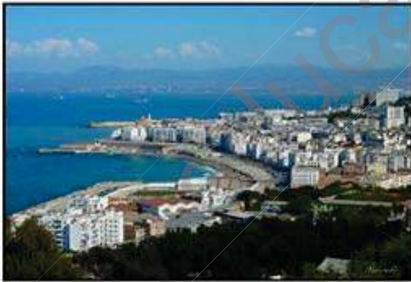
الوثيقة (2) : مدينة باب الواد

قصد التعرف على العوامل التي تؤدي الى تغير التضاريس و ما ينتج عنه من تطور في المنظر الطبيعي نقدم اليك الوثائق (1) (2) و(3):