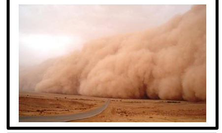
1/ عاصفة رملية تنقل الرمال المفككة

1/- اذكر المركبات الاساسية للمناظر الطبيعية .