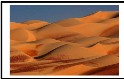
الوثيقة -3- كتبان رملية