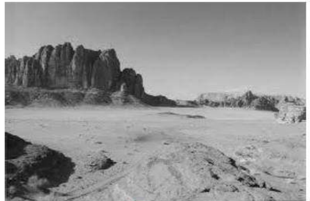
منظر لصحراء الجزائر

1-/- حدّد المكونات المحتملة لهذين المنظرين.