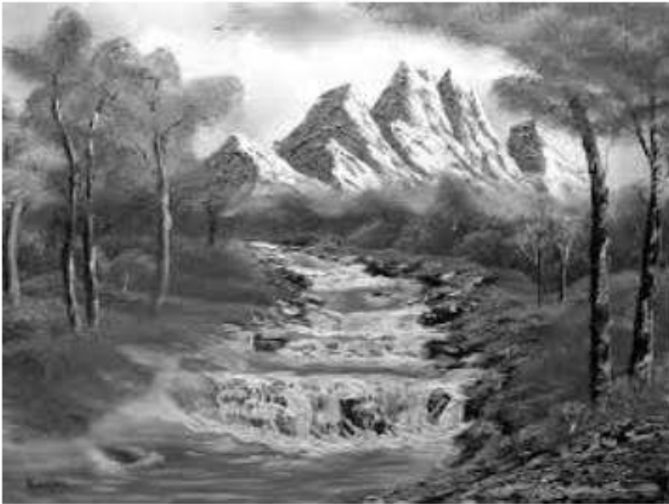
منظر لجبال الأطلس التلي

الوضعية الإدماجية: ( 08 نقاط ) طلب الأستاذ من التلاميذ جمع صور لتنوع المناظر الطبيعية في الجزائر فاختر أحد التلاميذ هاتين الصورتين: