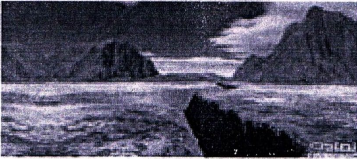
السد: باقى علاق من طور الشكل شرق إفريقيا