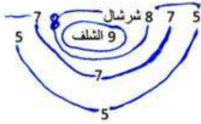
الوثيقة - 1