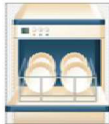
غسالة الأطباق 1500w