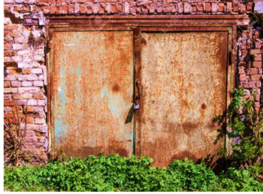
السند 2- : باب حديدي صدئ