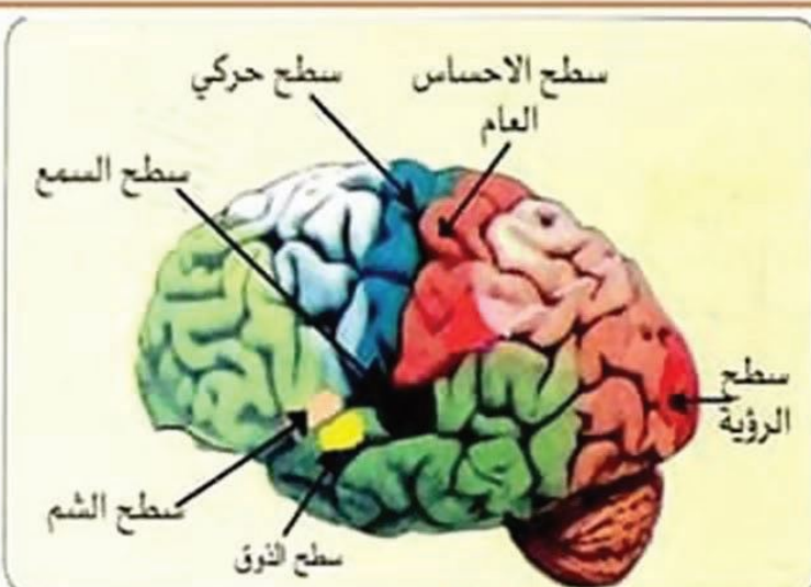
ب - السطوح الحسية في المخ