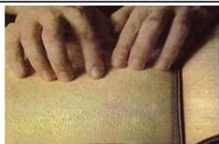
الوثيقة 1: تلميذ كفيف يستعمل كتابا خاصا مطبوع بالبراي (ثقوب على الورق)

إعتمادا الوثيقة (1) و الجدول (2) أجب عن التعليمات التالية: