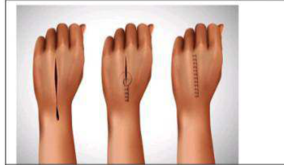
الوثيقة 1 : صور توضح جرح سامي قبل وبعد خياطته