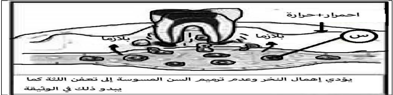
الوثيقة 1: حالة ضرس أخ سوء

الوضعية الأولى: (10ن) لسوء أخ صغير لا يحرص على نظافة أسنانه ولا ينتبه لغذائه، وذات يوم جاء يشتكي من ألم في ضرسه وانبعث رائحة كريهة من فمه وانتفاخ في الخد الموافق للضرس المصابة مع ارتفاع في درجة حرارته.