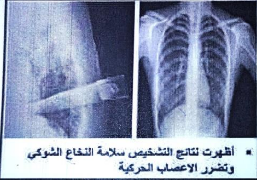
السند 2: موضع الإصابة

في حادثة مؤلمة بأحد المؤسسات التعليمية والتي راح ضحيتها إستاذة بعد تلقيها لطعنة سكين في الظهر من أحد التلاميذ. نقلت مباشرة وعلى جناح السرعة إلى أقرب مستشفى بالمنطقة لتلقي العلاج اللازم. لتتعرف أكثر عن سبب الإصابة ونتائجها نقدم اليك السندات التالية: