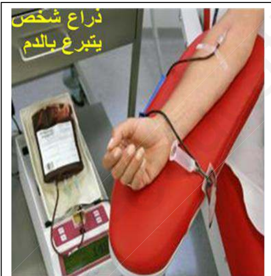
صورة تظهر عملية التبرع بالدم

لاحظ اخوك الصغير في اليوم العالمي للتبرع بالدم شريطا علميا يظهر الحركة المستمرة للدم حيث يمر بعدة اعضاء ( الرئتين ، الامعاء ، الكليتان ، العضلات .... ) مما اثار استغرابه وحيرته .