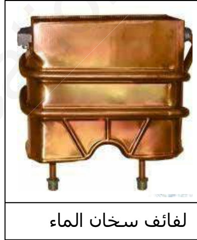
لفائف سخان الماء