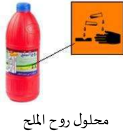
محلول روح الملح