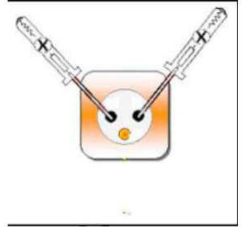
فحص المآخذ بالمفك قبل التشغيل