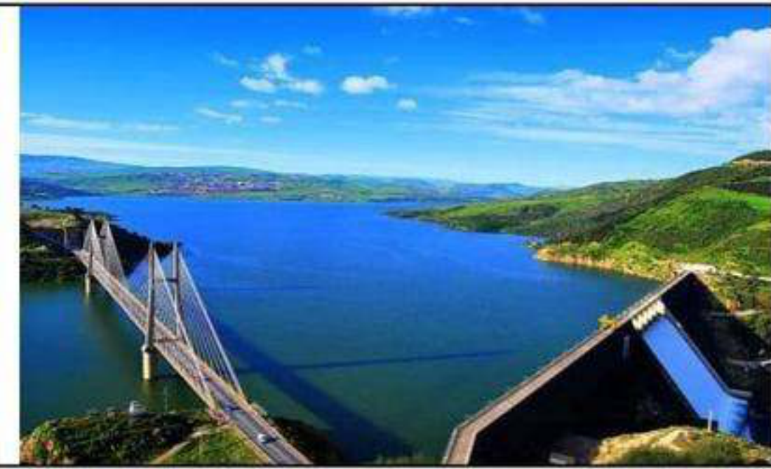
سد بني هارون – الانترنت -

السند 01 : ( ... تواجه الجزائر في الزراعة مشاكل طبيعية كثيرة منها قلة الأراضي الصالحة للزراعة إضافة لتصحّر التربة وقلة تساقط الأمطار أما المشاكل البشرية فتتمثل في قلة اليد العاملة التي تهرب من قطاع الفلاحة ( 10 % ) وتتوجه للخدمات ( 60% ) والزحف العمراني على حساب الأراضي الزراعية أما المشاكل لامادية فتتمثل في نقص الدعم المالي والأسمدة والعتاد الفلاحي ... ) الجغرافيا الاقتصادية للجزائر ص 75 -بتصرف - السند 02 :