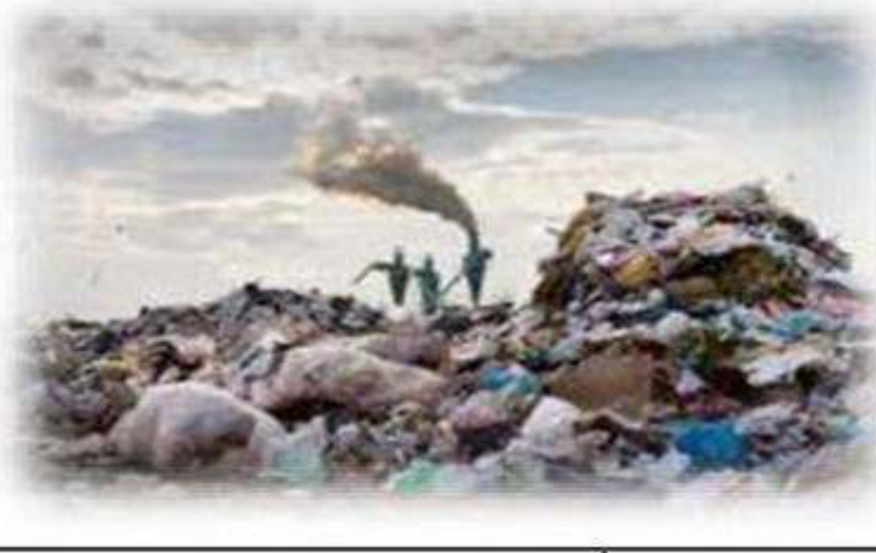
التلوث بأشكاله – الانترنت -