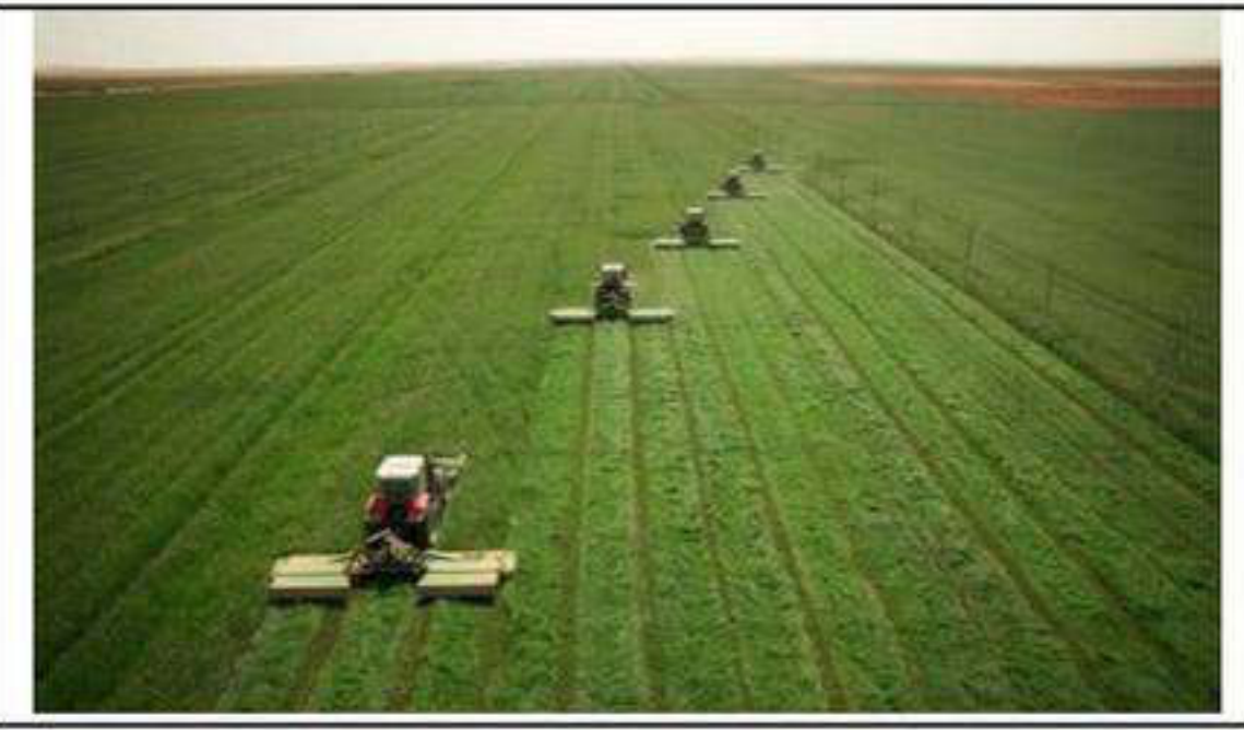
استعمال المكننة الزراعة – الانترنت -

التعليمة : قدم عرضك في موضوع من 10 أسطر مُستثمرا السنتين وموظفا مكتسباتك القبلية .