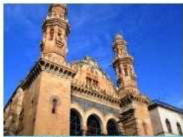
مسجد كتشاوة بالعاصمة و الذي حول الى كنيسة في عهد الاستعمار الفرنسي

السند: 02) (لقد وضعنا أيدينا على أموال الوقف و قضينا على مدارس و مساجد كانت موجودة...)) تقرير لجنة لاسكوتار الفرنسية 1878م