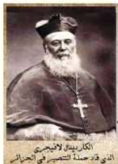
الكاردينال لافيغري الذي قاد حملة التنصير في الجزائر