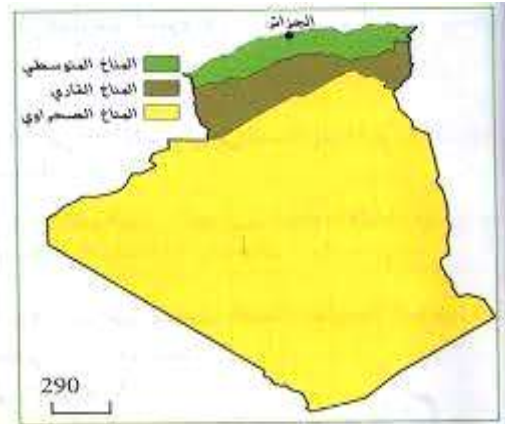
شكل (4) . خريطة الأقاليم المناخية في الجزائر